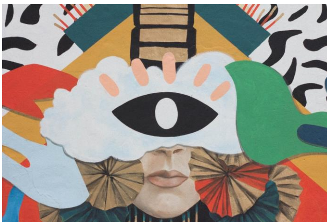
Ilustración 1

El arte es una producción humana, caracterizada por estar concebida socialmente. Hay "acuerdos" en los que se establece qué podemos observar como arte y qué no, esto va cambiando con el tiempo y el lugar. Van Gogh no fue considerado un gran artista hasta después de su muerte, Miguel de Cervantes fue reconocido solo hacia el final de su vida... y así, muchos personajes están fuera de su tiempo, y por ello, no se sujetan a los parámetros que condicionan lo que es arte y lo que no. Esto puede ser confuso porque no hay una definición tajante de arte y puede llegar a ser tan subjetivo que se pierde y se difumina.