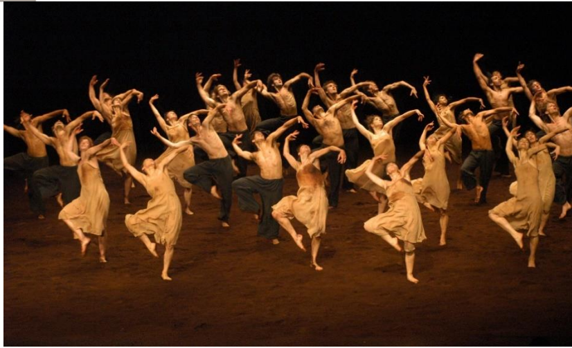
Ilustración 2 Coreografía de Pina Bausch